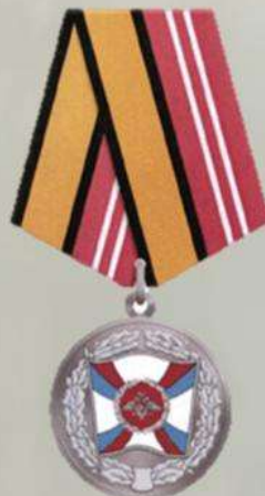
МЕДАЛЬ "ЗА УКРЕПЛЕНИЕ БОЕВОГО СОДРУЖЕСТВА"