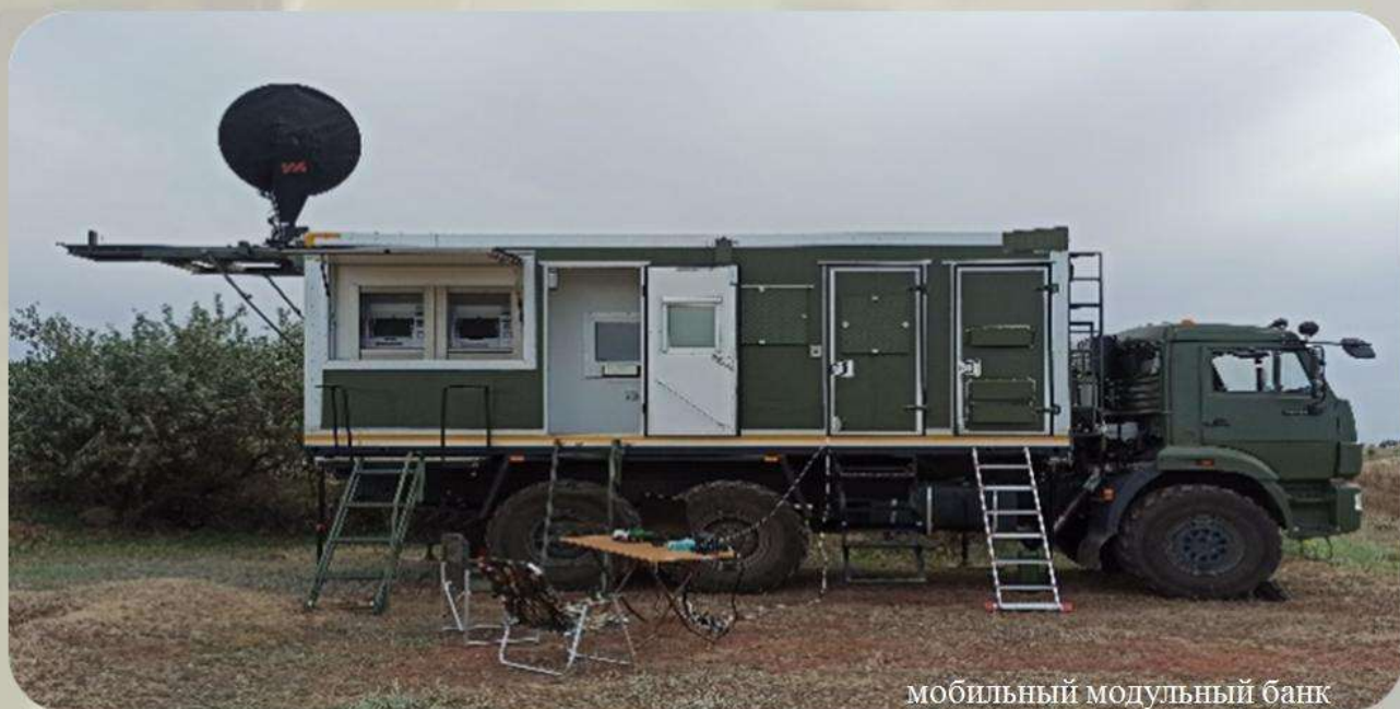
МОБИЛЬНЫЙ МОДУЛЬНЫЙ БАНК